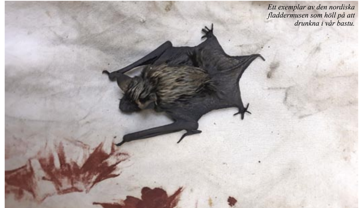
Ett exemplar av den nordiska fladdermösen som höll på att drunkna i vår bastu.