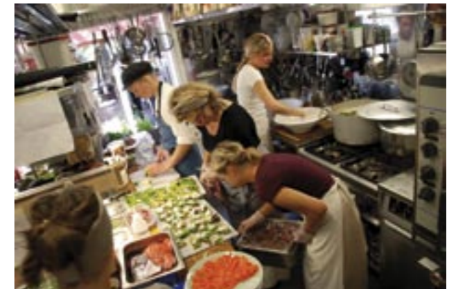
De små detaljerna är avgörande