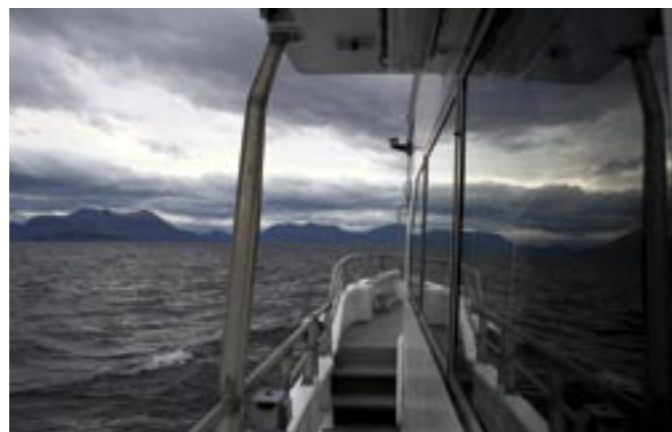
Gamla Nordsjön vajar och svajar.

– Skagerak var problematisk med vågor från alla håll. Längs svenska kusten var det motvind hela vägen ända upp till Kapellskär. Därifrån styrde vi över Ålands hav och via Föglö mot Utö. Efter det var vi snart framme i Rosala, den 19 november. Jag hann bli vän med Sissel som är van med kyla och storm. Vi behövde inte frysa ombord.