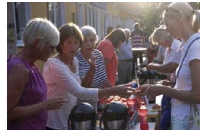
Aktiva damer vid försäljningsbordet

För att upprätthålla Vikingaborg krävs en hel del energi och engagemang. Dessvärre står huset mer eller mindre oanvänt under vintermånaderna även om huset är väl rustat. Att ställa till med dans är inte alls lika enkelt som förut. Tillstånd ska begäras, ordningsmännen ska vara utbildade, orkestrarna är dyra och om publiken uteblir åker föreningen på en rejäl förlust. Helt hopplost är det inte, det finns billigare alternativ med inbjudna gäster och musik som kommer från bandspelare.