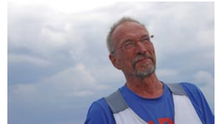
Gullkrona fjärd i blickfånget

Torvalds-Westerlund, Malena (2009), Tunhamn. Helsingfors: Litorale