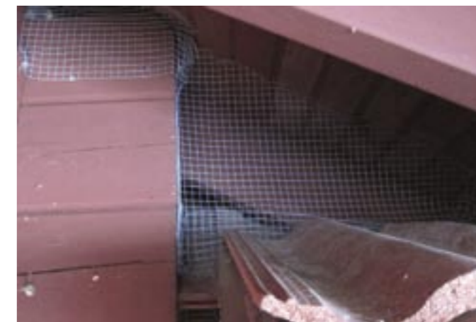
Metallnät hindrar vägglusens värd att komma in i huset.

Vägglusen är numera en allmän gäst i bostäder, både