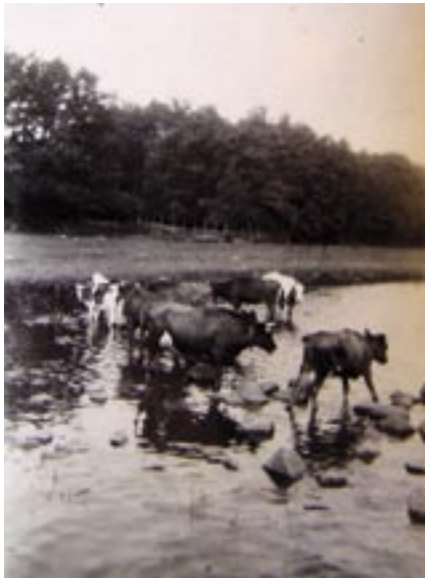
Prästgårdsflickor och koddor i Stubbns strandvatten.