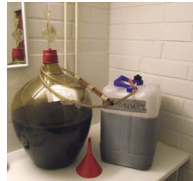
Bubbel i glaset, processen i full gång

Även på mindre holmar kokades hembränt, överallt i praktiken där det bodde folk i forna dar. Och visst ryktas det om att sånt sker i dessa tider också, men på grund av sakens känsliga natur och olaglighet, talas det om saken