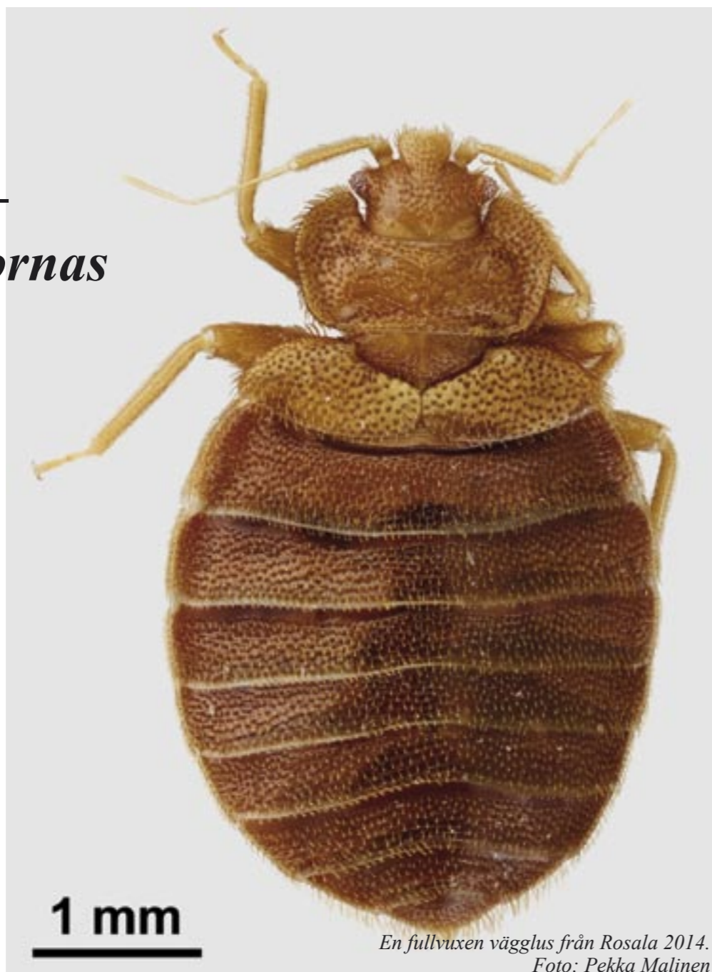
En fullvuxen vägglus från Rosala 2014.