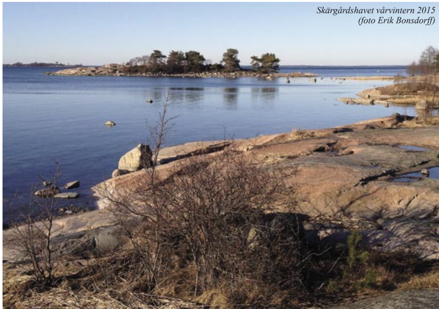
Skärgårdshavet vårvintern 2015