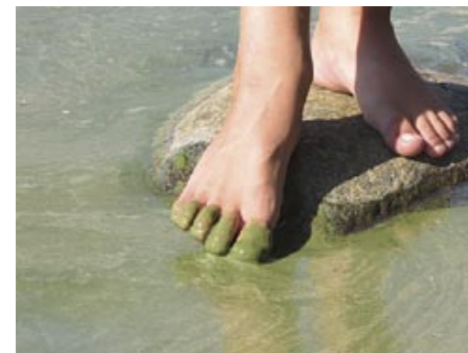
Blågröna alger

Östersjön fick äntligen, efter drygt 10 års väntan, vid jultider 2014 en ordentlig livgivande saltvattenpuls; ca 300 km 3 högsaltigt vatten strömmade in och lade sig längs Östersjöns botten. Det är dock under 1% av Östersjöns totala vattenvolym (drygt 20.000 km 3 ) och mindre än 10% av den totala beräknade volymen syrefattigt vatten (ca 3.000 km 3 ). Så även om Östersjön nu kanske fick naturlig hjälp med konstgjord andning, talar vi sannolikt