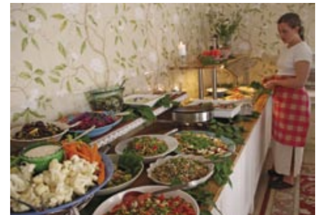
Alexandra dukar upp husets läckerheter