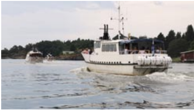
Rosala flottan stävar mot Bengtskär