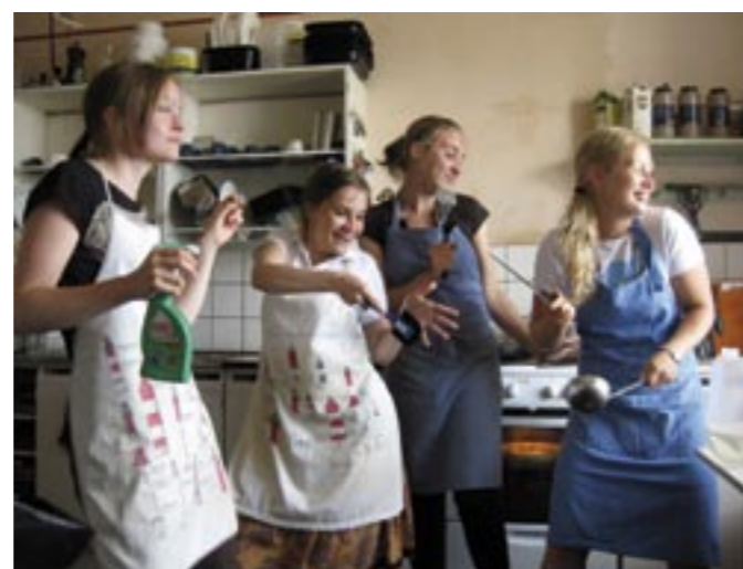
Fyr i spisen, fullt pådrag i köket

De vänner jag fått på Bengtskär är vänner för livet, de är mer än vanliga arbetskamrater eftersom vi delar arbete och fritid dygnet runt. Rummen delas med fyra andra och äppelkaka mellan oss alla tio. Även tandborstar kan lånas för här finns ingen butik. Livet här levs anspråkslöst och det gäller att vara nöjd med det man har. Mer behövs inte, för vi har allt: havet och tryggheten. För vad kan vara tryggare än en bastant gammal stenfyr mitt i ett stormande hav? Och storma har det gjort, i den grad att fyrdörrarna knappt gick att öppna, vågorna var höga som hus och i fönstren visslade vinden melodier. Ingen kunde ta iland på ön och ingen kunde åka iväg. Under tiden sopade vi alla 252 trappsteg upp till fyrlyktan och plockade mat ur frysen i väntan på att stormen bedarrar. Tänk att vara barn och bo på fyren under höststormarna, vad rastlös man skulle bli!