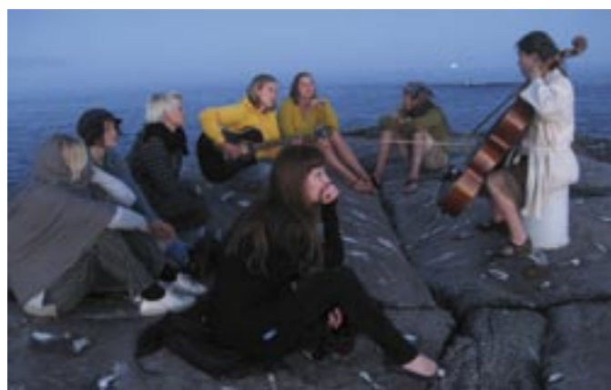
Den lediga stunden välkomnas med musik

De som inte går i tid i sängs lider av det nästa dag. På morgonen ska morgonmålet lagas och morgonmötet hålls där vid 9-tiden. Under morgonmötet bestämmer vi vem som guidar vilken grupp, vem som bakar semlorna, vem som förbereder lunchen, vem som städar hotellrummen och toaletterna etc. Min favorituppgift är att ta emot småbåtar. Speciellt under fina sommarkvällar kan det komma en drös med småbåtar som skall välkomnas! Då får man springa barfota på klipporna och spana efter bra hamnplatser! Oftast är det pojarna som gör det grova ute jobbet, flickorna står i köket. Tursamt har personalen på Bengtskär bestått av feminister och fritänkare som fått förändring till stånd. Jag tillbringade en vecka med att skrapa bort målarfärg på yttre sidan om fyrlyktan högst upp i tornet. Det var en ljuvlig stämning där uppe, i blåa overaller hängde vi ut över sjön och däremellan passade vi på att kila ner efter bullar när doften nådde upp till våra känsliga näsor! Blåsorna på händerna förlorar i betydelse på dessa höjder.