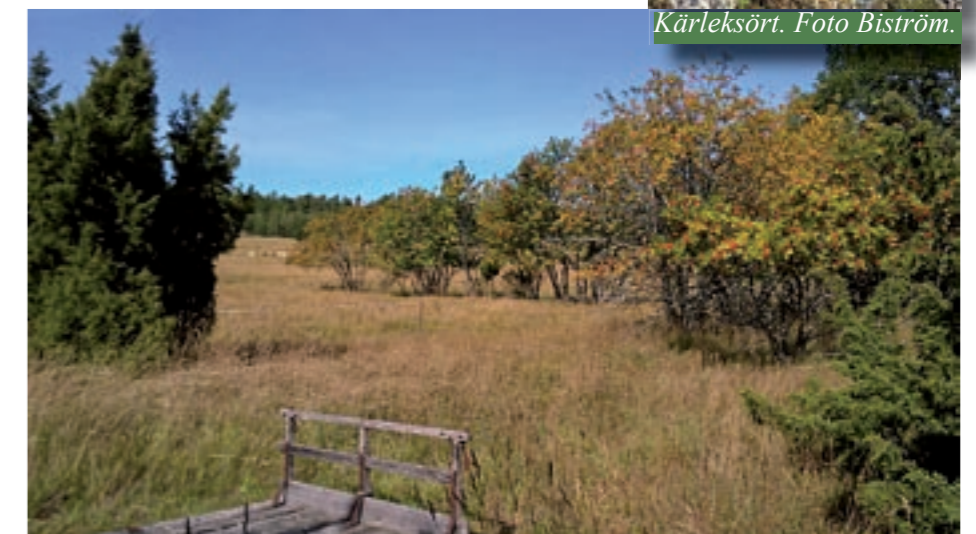
Gammal kulturmark i Hitis är värdefull och hyser flera fågelarter och insekter.