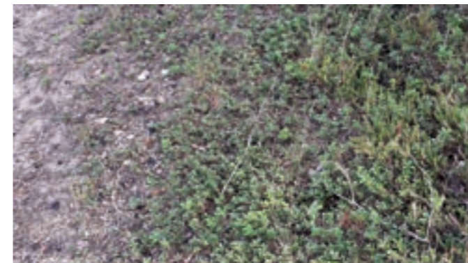
Längre upp på strand börjar ett bälte med ris; mjölon, ljung och kråkbär.

också specialiserat sig för ett liv i fin sand. Man kan ofta se dess konformade gropar i sanden – de fungerar som fällor för andra insekter och spindlar som är myrlejonets mat.