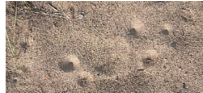
Dynens förrådiska konformiga gropar är myrlejonens tillhåll. Larven är ett glupskt rovdjur som gömmer sig i gropens botten och väntar på ett lämpligt byte.

Sandstranden finns i RoHit området men är sällsynt och den bildas enbart under särskilda förhållanden. Strandtypen är en så kallad ackumulationsstrand. Enbart fin sand täcker stranden och den förs med vattnet från bottenmaterialet upp på det torra med vågornas hjälp. Därifrån kan den fina sanden föras vidare med vinden och bilda dyner. Strandregionen ”lever” hela tiden och växterna har svårt att slå rot i den fina sanden. Därför är stranden fattig på växter men det finns ändå några som klarar av konststycket. I RoHit området växer åtminstone gräset strandråg, saltarv, två ärtväxter, strandvial samt käringtand. Längre upp på stranden lyckas till slut några risväxter (ljung, kråkbär och mjölon) bilda bestånd som kan växa kring tallarna. Myrlejonet (en sländeart) har