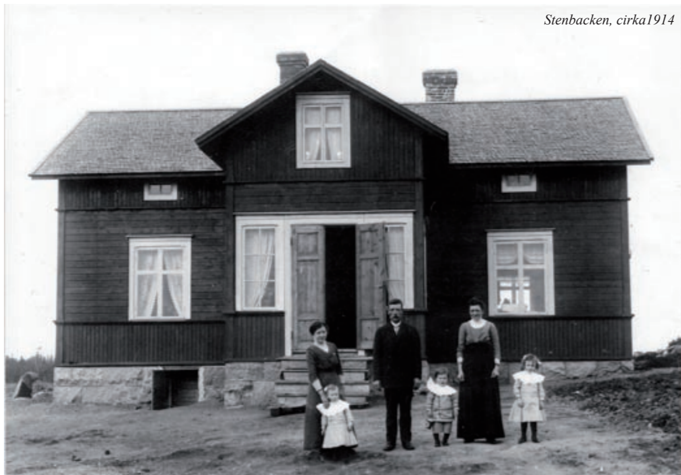
Stenbacken, cirka 1914