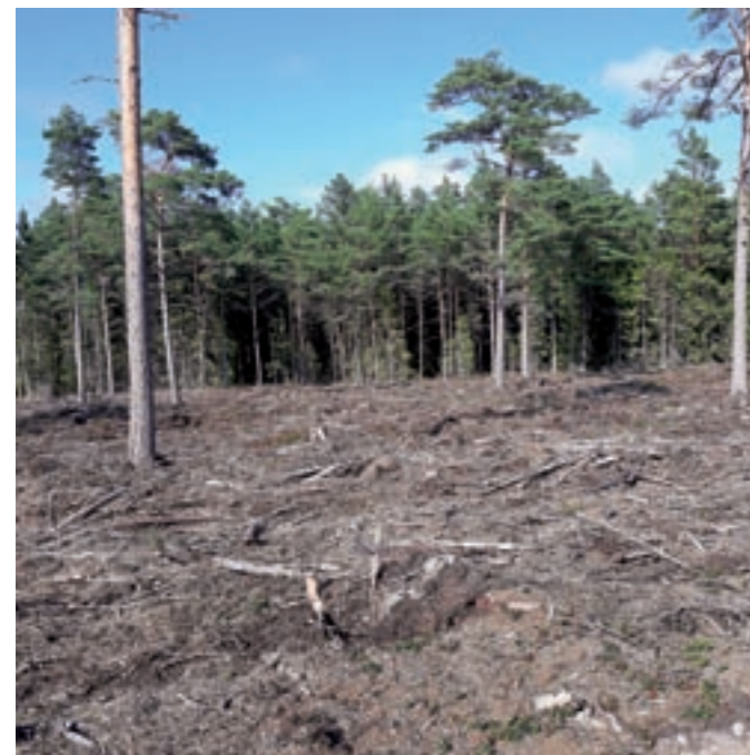
Landskapet ser bedrövt ut efter ett kalhygge följt av markberedning.

Virkestuttagningen har under de senaste åren vuxit kraftigt vilket torde bero på ekonomiska orsaker, det betalda priset har stigit och är högre än på länge. Det är förståeligt att ägarna önskar maximera vinsten, å andra sidan förlorar man i trivsel, landskapen blir tråkiga.