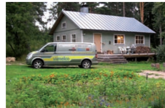
Helis krassar och ringblommor blommar

Text: Jan Sundberg