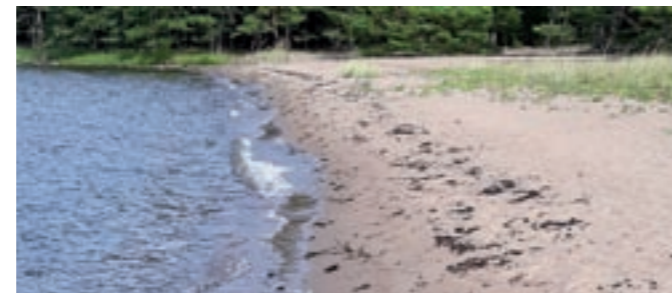
Sandstrand i typiskt dynlandskap på Rosala. Observera den sparsamma vegetationen nära havet.

Stränderna är en miljötyp som hotas allra mesta av människan. I RoHit området kan vi särskilja på några