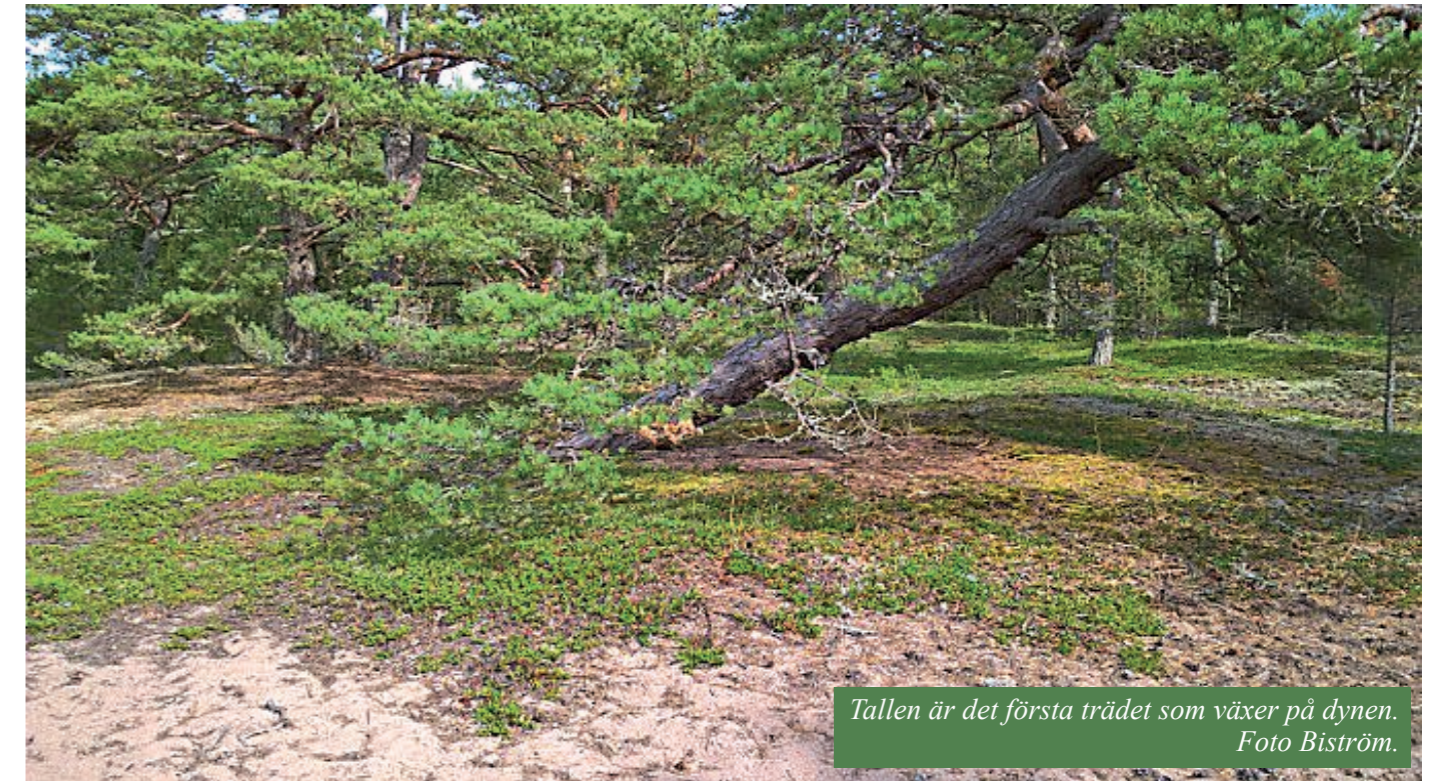
Tallen är det första trädet som växer på dynen.